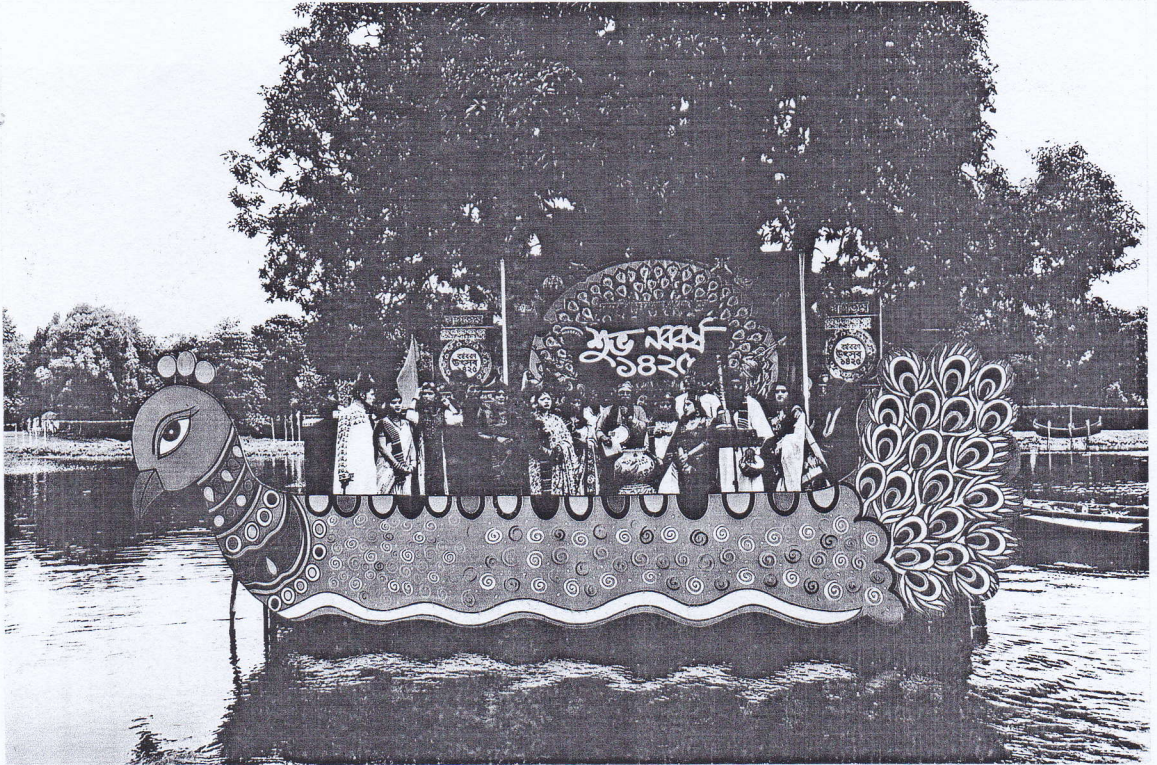
বর্ষবরণ উৎসব ১৪২৫ উপলক্ষে বিলের জলে ভাসমান আনন্দধারা মঞ্চের সাংস্কৃতিক অনুষ্ঠান