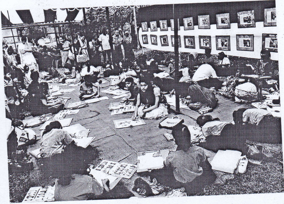
মহান ২১ শে ফেব্রুয়ারি ও আন্তর্জাতিক মাতৃভাষা দিবস উপলক্ষে ফাউন্ডেশন কর্তৃক আয়োজিত শিশু চিত্রাংকন প্রতিযোগিতা