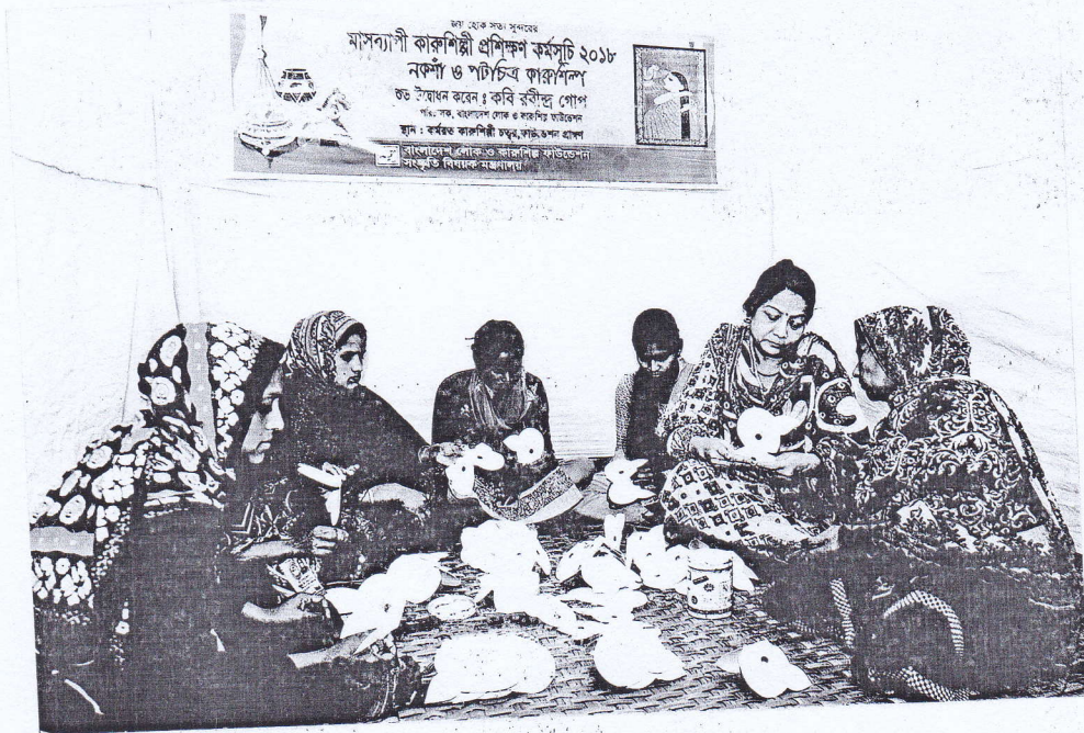
ফাউন্ডেশন আয়োজিত কারশিল্পী প্রশিক্ষণ কর্মসূচিতে নকশা ও পটচিত্র কারশিল্পের প্রশিক্ষক ও প্রশিক্ষণার্থীবৃন্দ